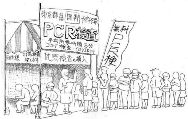
まちかどスケッチ 田中芳樹

一時期は閉古鳥が鳴いていた PCR 無料検査所でしたが、急激に感染が広がると行列ができるようになりました。急ごしらえのテント場も、科学的な検査によって安心を届けられる大切な場となっています。